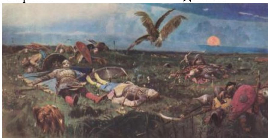
В. М. Васнецов. «После побоища». 1880 г.