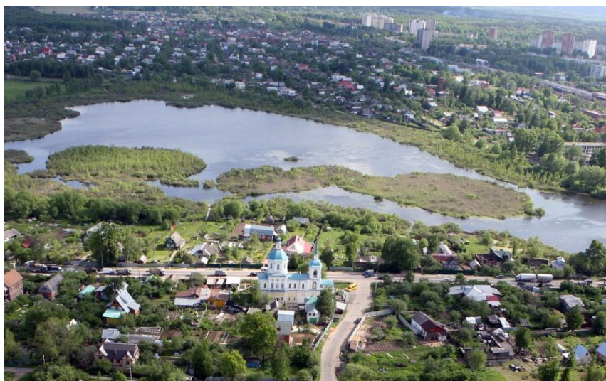
Современная фотография озера Киёво

2 Выберите одну из предложенных тем для подготовки монологического высказывания.